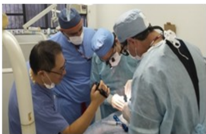
Chirurgia su paziente